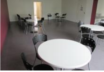
Salle de détente du rez-de-chaussée