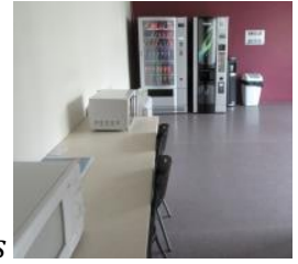
Distributeur de boissons